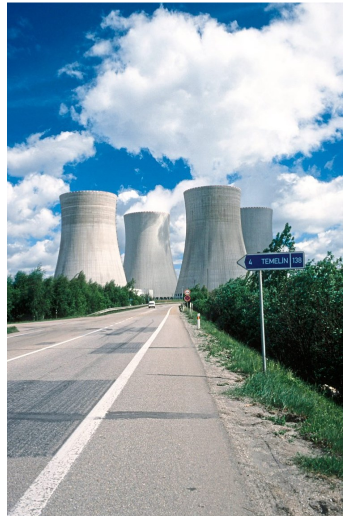
Eine große Zukunft ist den Atomkraftwerken wohl nicht beschieden. Wahrscheinlich ist, dass die aktuellen Kapazitäten gehalten werden oder leicht sinken.

Müllner: Ja. Die Sicherheitsstandards der IAEA wurden nach Fukushima stark überarbeitet. Früher war es etwa nicht vorgeschrieben, dass überhaupt Pläne für den Fall einer Kernschmelze vorliegen. Neue Reaktoren müssen nun zeigen, dass sie mit einer Kernschmelze umgehen können – etwa mittels eines Core-Catchers, der das Kernmaterial im Ernstfall abfängt und kühlt. Bei bestehenden Anlagen sind Nachrüstungen auf den letzten Stand der Technik aber oft nicht möglich. Das ist auch in Europa ein Problem, weil hier die Reaktoren sehr alt sind.